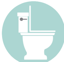
Vómitos / Diarrea

Una fiebre de 100 F (37.6 c) o más. Niños pueden regresar a la escuela cuando no tienen fiebre para 24 horas (SIN uso de medicina para reducir fiebre).