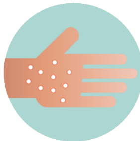
Lesiones cutáneas / Llagas

Cualquier erupción nueva con fiebre. Puede regresar después que la erupción termina o permiso por escrito otorgado por el proveedor de atención médica